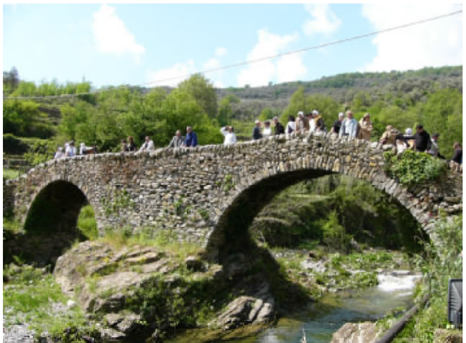
Une partie du Conseil Municipal et des Messuguié sur le pont sur le PRINO, 1er mai

Pour l'Union Européenne, "Le jumelage, c'est la rencontre de deux communes qui entendent proclamer qu'elles s'associent pour agir dans une perspective européenne, pour confronter leurs problèmes et pour développer entre elles des liens d'amitié de plus en plus étroits".