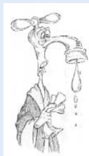
René, la goutte au nez

L'exposition est encore visible jusqu'au 13 Avril.