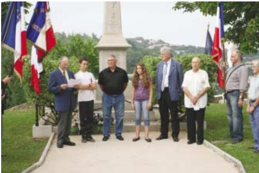
Commémoration du 8 juin

Le 14 juillet devient la fête nationale seulement en 1880, et depuis cette année-là, de nombreuses manifestations ont lieu partout en France.