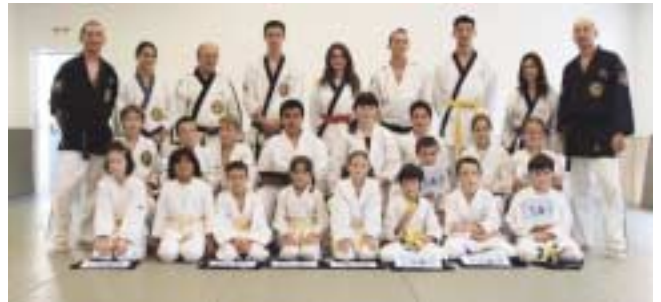
Passage de grades des enfants en fin d'année