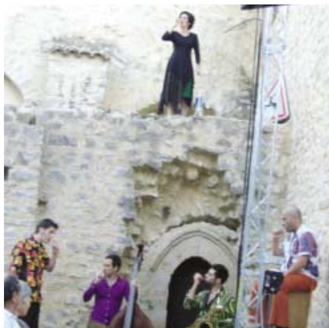
Les Biches de mer